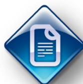
Tabela de coeficientes de abate